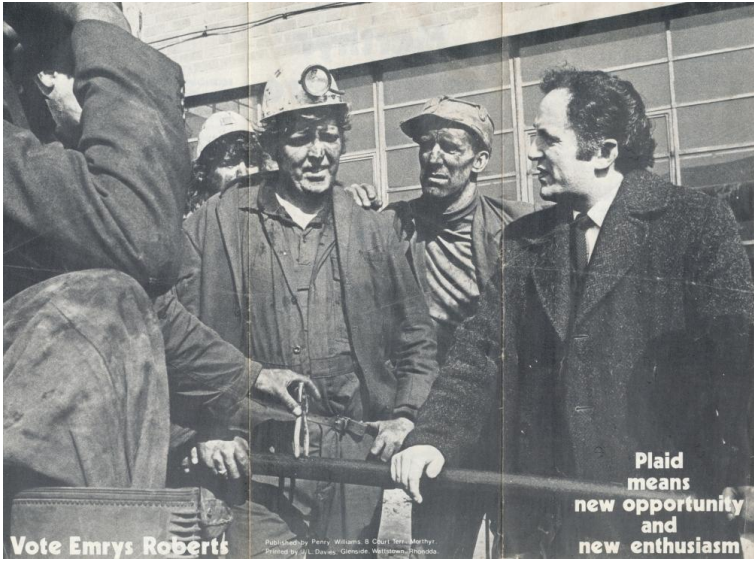
Taflen ymgyrch Is-etholiad 1972